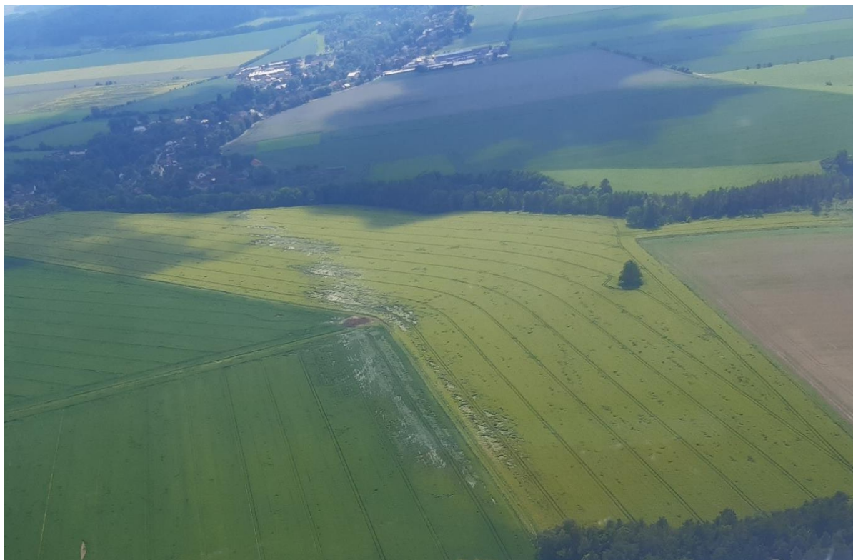
Foto 1: Letecký snímek západní části obce Lubná se škodami v polích po tornádu.