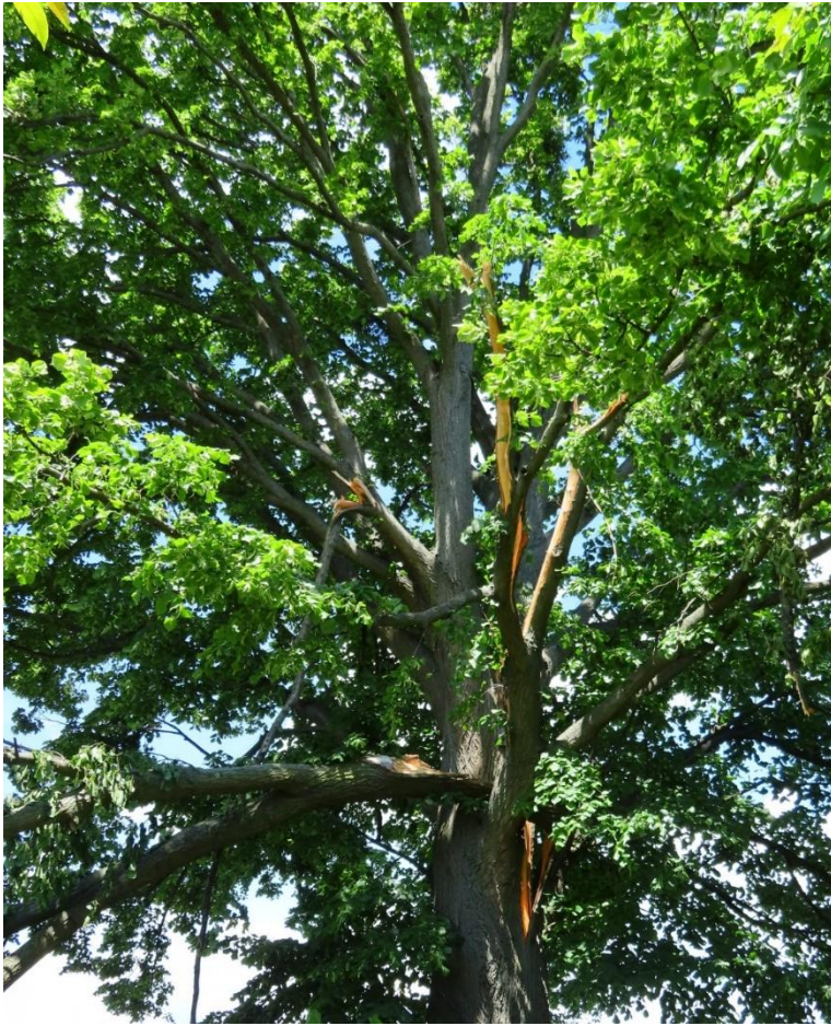
Foto 3: Zlomené větve mohutné lípy na okraji obce Lubná.