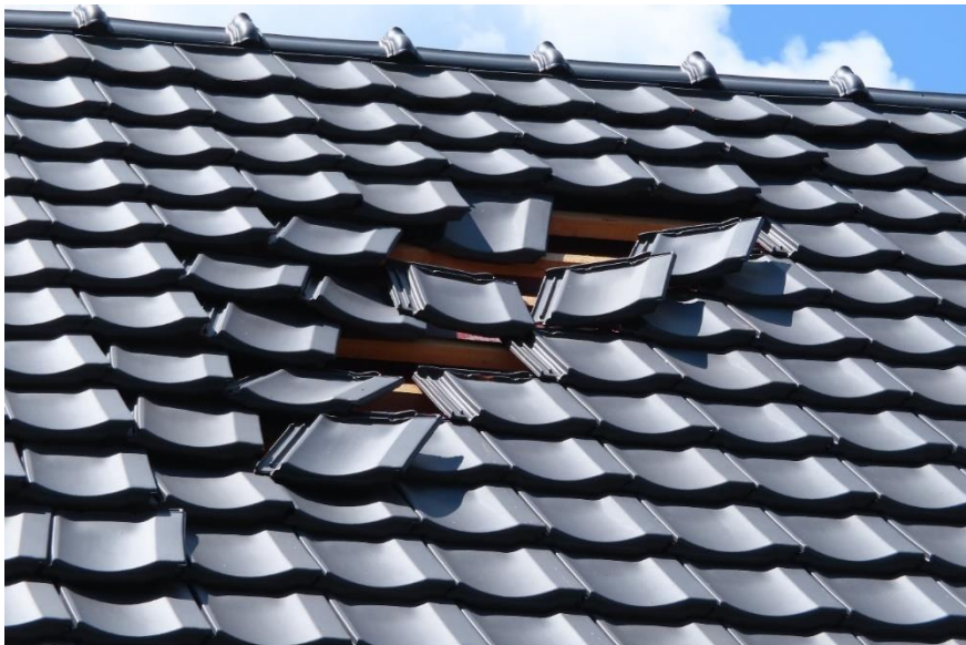
Foto 4: Velmi lokální zesílení rotace tornáda a následné škody na střeše jednoho z poškozených domů.