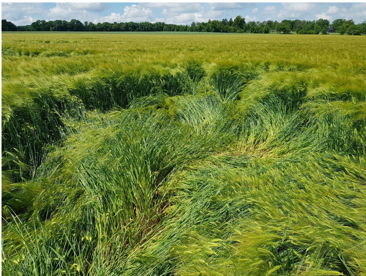
Foto 5: Slehlé klasy ječmene v poli na jihu obce, poslední lokalita se škodami.