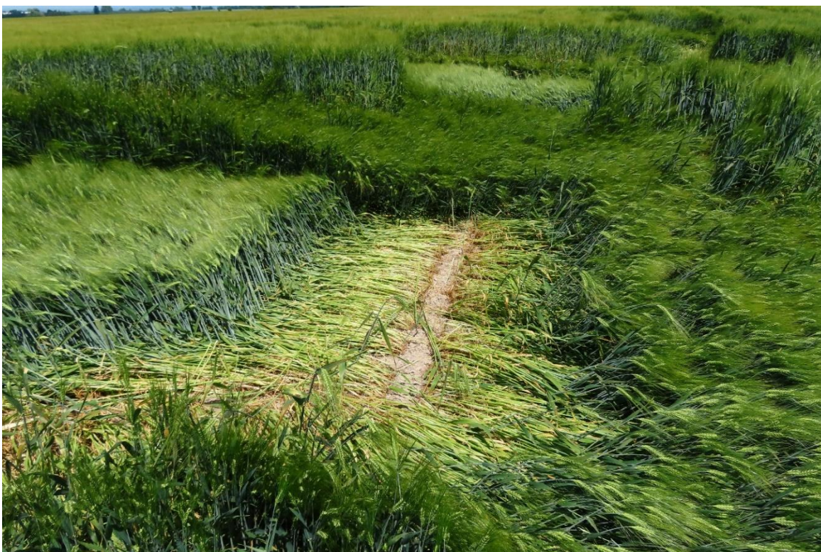
Foto 2: Slehlé klasy ječmene podle síly proudění u země na počátku trasy tornáda.